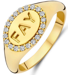
Ring Miro € 2359,-