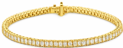
Tennisarmband Coco € 7999,-