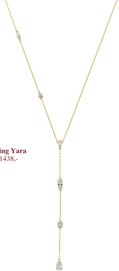
Ketting Yara € 1438,-