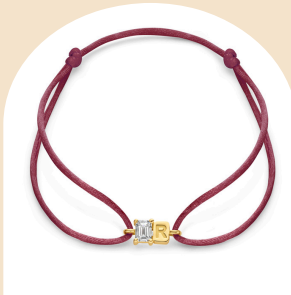
Satin Bunny € 419,-