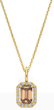
Ketting Livia Mokka 1,0 mm ketting € 1398,-