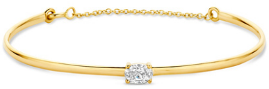
Spang Area € 2429,-