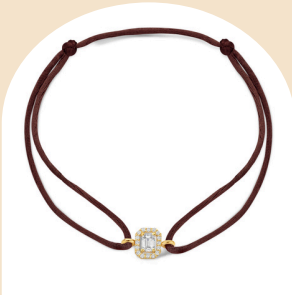
Satin Elin € 489,-