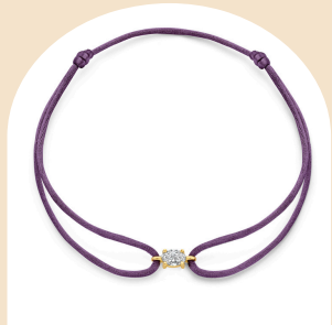
Satin Jane € 329,-