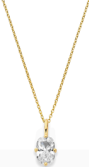
Ketting Fiora 1,0 mm ketting € 1318,-