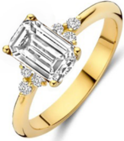
Ring Elvera € 1989,-