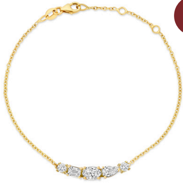
Armband Eline € 1728,-