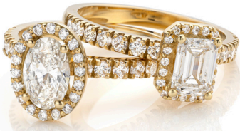
Ring Hazel & Michelle € 2529,- p.s.