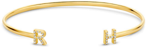
Spang Valerie € 2359,-