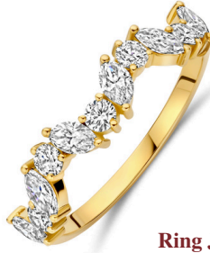
Ring Joan € 1459,-