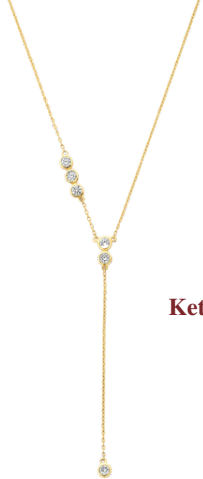
Ketting Rosie € 938,-