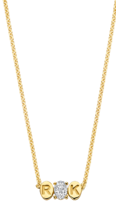
Ketting Molly 1,0 mm ketting € 868,-