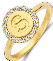
Ring Alix € 1169,-