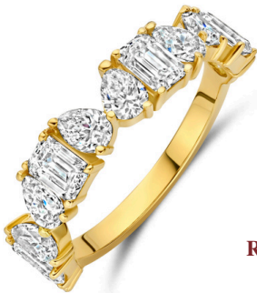
Ring Amora € 2929,-

“Two journeys. One timeless connection.”