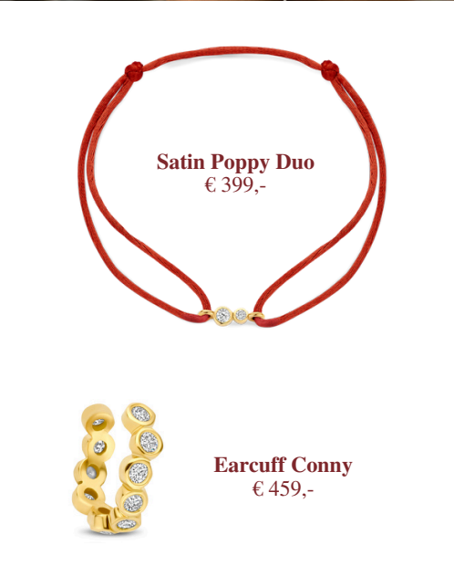
Satin Poppy Duo € 399,-