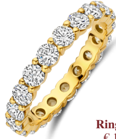
Ring Milly € 1059,-