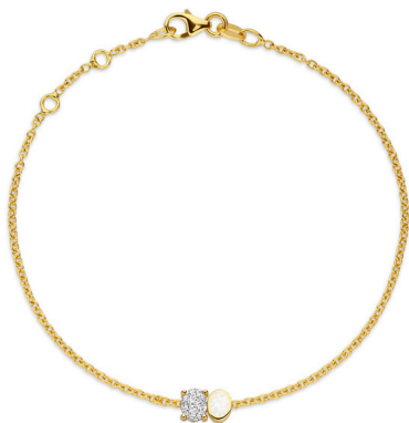
Armband Lena Moment € 608,-