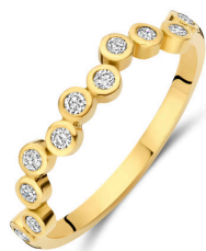
Ring Dollie € 1039,-