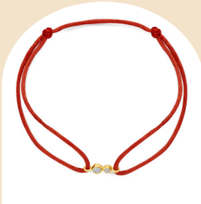
Satin Poppy Duo € 399,-