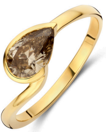
Ring Jessie Mokka € 2739,-