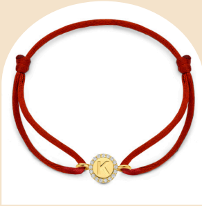
Satin Diana € 509,-