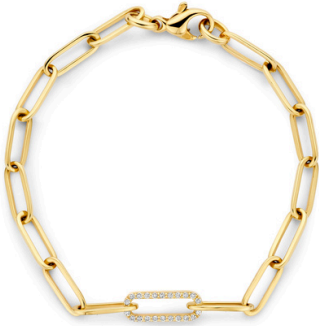
Armband Jade Paperclip € 2428,-

“Voor momenten die gezien mogen worden.”