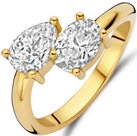
Ring Lorena € 2149,-

De Toi et Moi collectie symboliseert een verbinding die verder gaat dan het moment. Twee verhalen die elkaar versterken, twee krachten die samen groeien.