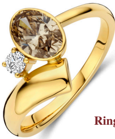
Ring Caro Mokka € 2969,-

De Mokka lijn is verrijkt met zeldzame bruine diamanten die zorgen voor een warme, diepe glans. Een luxe uitstraling die zich op subtiele wijze onderscheidt.