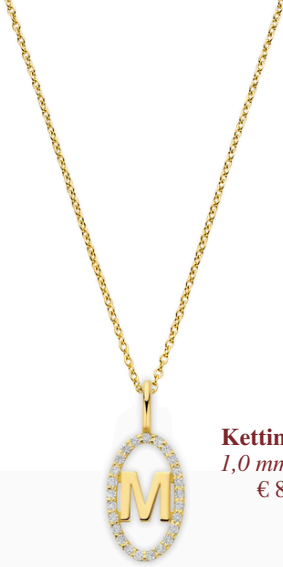
Ketting Muse 1,0 mm ketting € 878,-