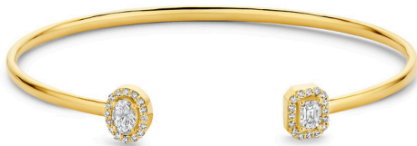
Spang Florance € 2959,-