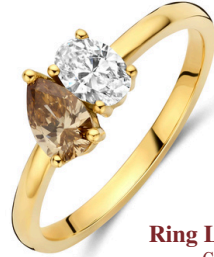
Ring Lora Mokka € 1629,-

De Mokka lijn is verrijkt met zeldzame bruine diamanten die zorgen voor een warme, diepe glans. Een luxe uitstraling die zich op subtiele wijze onderscheidt.