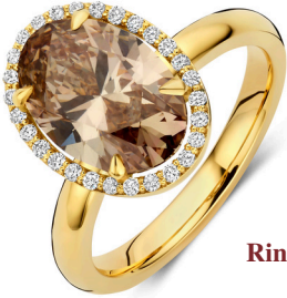
Ring Selina Mokka € 5819,-