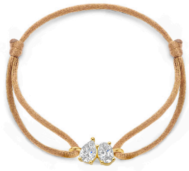
Satin Eva € 589,-