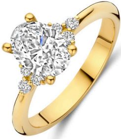
Ring Aura € 1989,-