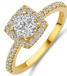
Ring Simone € 1799,-