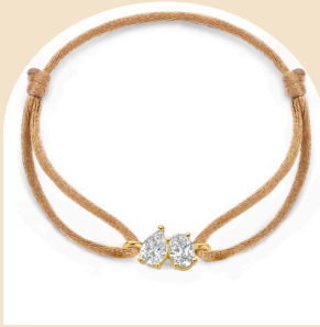
Satin Eva € 589,-