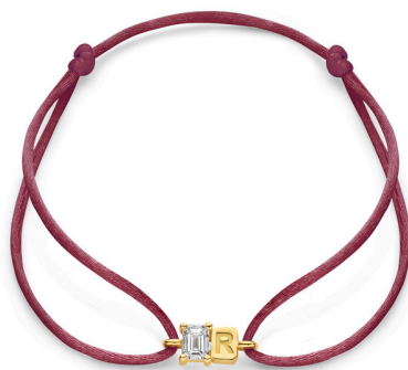
Satin Bunny € 419,-