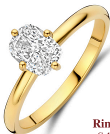
Ring Ella € 1719,-

“One stone to mark the moment that changed everything.”