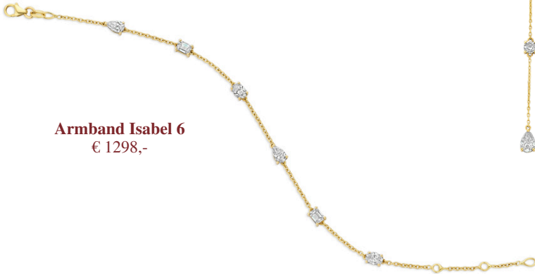
Armband Isabel 6 € 1298,-