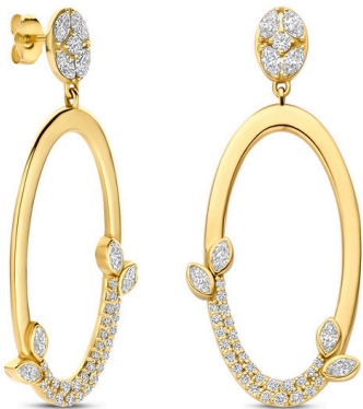
Oorstekers Janne Deluxe € 4769,-