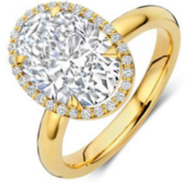
Ring Selina € 3949,-