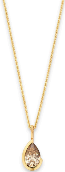
Ketting Nola Mokka 1,0 mm ketting € 2288,-