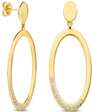
Oorstekers Janne € 2699,-