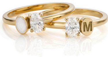
Ring Bella € 999,-