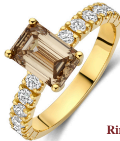
Ring Stella Mokka € 3109,-