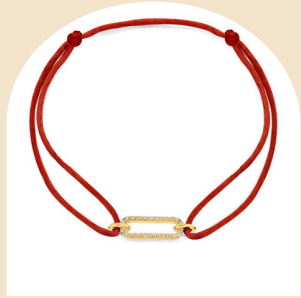
Satin Fleur € 599,-