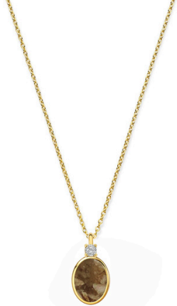
Ketting Indy Moment 1,0 mm ketting € 868,-