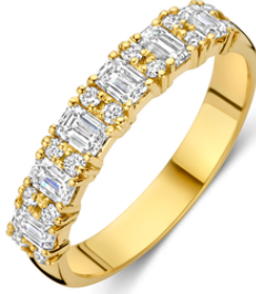
Ring Noé € 2299,-