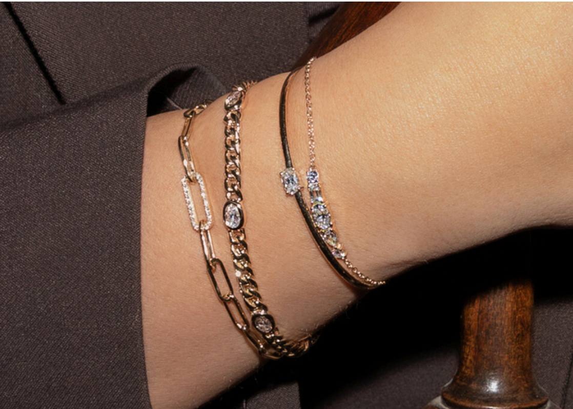
Armband Nova Gourmet € 5114,-