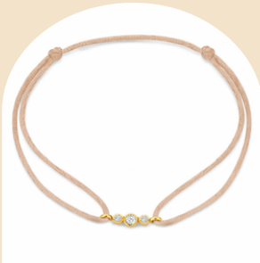
Satin Poppy Trio € 499,-