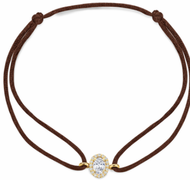
Satin Emily € 489,-