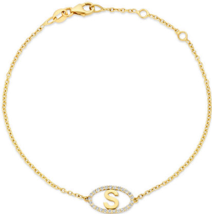
Armband Celeste € 878,-