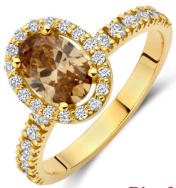
Ring Michelle Mokka € 3269,-