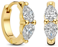
Creolen Marly € 1349,-