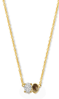
Ketting Nina Moment 1,0 mm ketting € 798,-