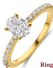
Ring Hariette € 1399,-